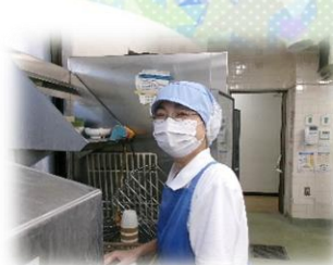
心を込めて盛り付け頑張っています。(盛り付け担当)