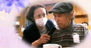
お一人ずつインタビューをし、コメントをいただきました。