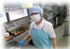
きれいな盛り付けを心掛けています。(盛り付け担当)