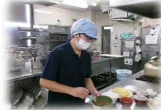
心を込めて調理しています。(調理担当)