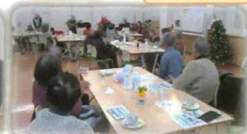
「Spring-5」のクリスマスソングの演奏