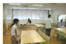
会場設営する子どもたち