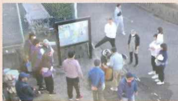
グリーンハイムいずみ野 A地区自治会

年末恒例の「餅つき大会」が各地で開催されていきました。いずれも天候に恵まれ、多くの方で賑わっていました。