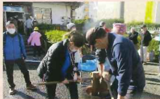
グリーンハイムいずみ野 C地区自治会