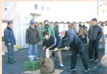
南いずみ野自治会