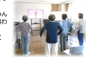
お問い合わせ：星川地域ケアプラザ