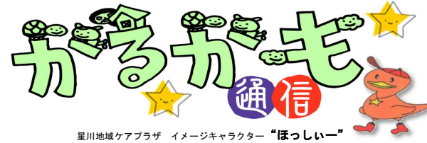
星川地域ケアプラザ イメージキャラクター「ほっしー」

発行：福) 横浜市福祉サービス協会 横浜市星川地域ケアプラザ 住所：横浜市保土ヶ谷区川辺町5-11 TEL：333-9500 FAX：340-2100 http://www.hama-wel.or.jp/office/hoshikawa/index.html 発行責任者：所長 大和田 佳恵 地域交流版 第155号 R8年7月1日発行