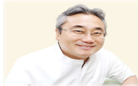
新子安地域ケアプラザ 協力医

夏の夕暮れ、ヒグラシの声とともに窓からさわやかな風が入って来て風鈴が鳴る、懐かしい風景ですが今の夏はあの頃の夏よりもちょっと厳しくなりましたよ。