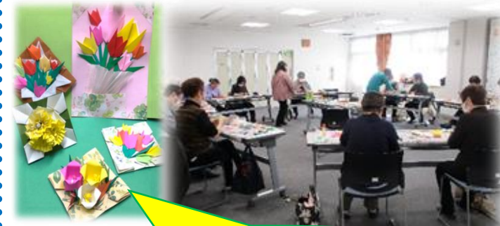
写真は昨年の作品と制作風景。今年は何を作るのかな？